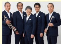
アカペラコーラス タイムファイブ

参加申込: 参加申込用紙にてFAX申込み、またはホームページからもダウンロードできます。 申込み受付後、参加費振り込みのご案内をはぎにてお知らせします。 2018年5月10日(木) までにご入金ください。ご入金の確認後、正式な参加登録となります。入金後の返金は一切受けられません。